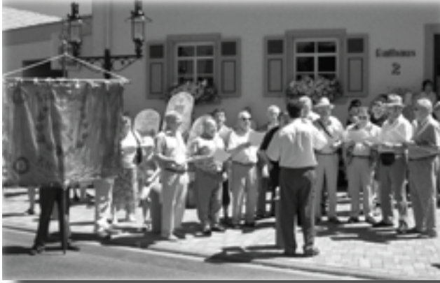
Männerchor des MGV vor dem Rathaus

Ziel der Familienfahrt 2005 war die befreundete Partnergemeinde Plittersdorf am Rhein. Hier feierten zum einen die Sangesfreunde vom Liederkranz Plittersdorf ihr 100 jähriges Vereinsbestehen und zum anderen die Gemeinde selbst 1275 Jahre Plittersdorf. Das Jahr 2005 war für