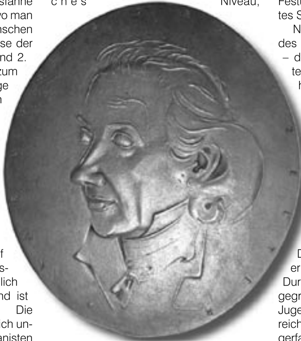
CARL FRIEDRICH ZELTER

lebten den nun als ‚Männergesangsverein‘ auftretenden Chor in einer Blütephase: einerseits erreichte der Verein durch intensive Probenarbeit ein beachtliches Niveau,