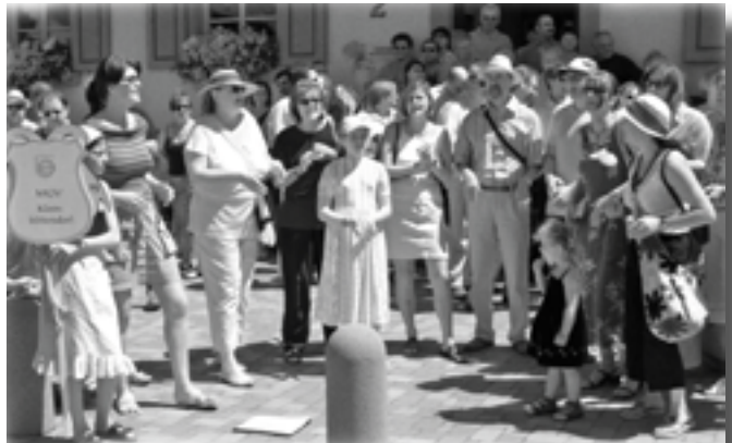
Gospelchor -Humble Voices-

Sehr hilfreich zur Planung dieser Familienfahrt nach Plittersdorf war die sehr schön gestaltete Website des Ortes, auf