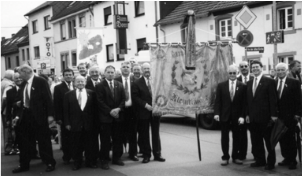
Der Jubiläumschor im Jahre 2002 nimmt Aufstellung zum Festumzug 1225 Jahre Kleinblittersdorf