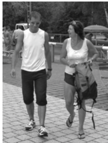
Durchnässte Ankunft in Altenglan

hends und ein Gewitter zog auf. Nach einem heftigen Regenschauer kam auch bald wieder die Sonne hervor. Völlig durchnässt und ausgeleigt erreichten unsere beiden Draisinen schließlich Altenglan. Wieder in trockenen Kleidern wurden bei einem Abschiedstrunk noch einmal die Stationen