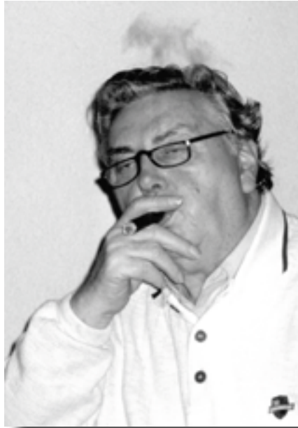
Das Markenzeichen unseres Ehrenvorsitzenden ist seine Zigarre.