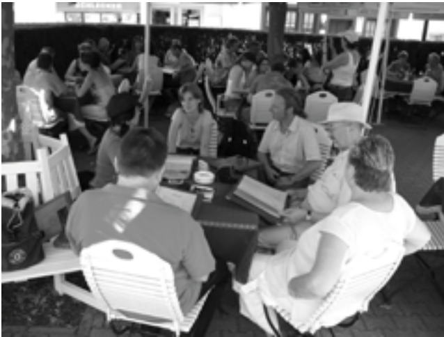
Draisinentour des Gospelchores am 30.07.2006

km lange Strecke. Der erste Teil der Strecke wurde spielend zurückgelegt. Vorbei an Odernheim, Rehborn und Raumbach kam man zur Mittagszeit in dem schönen Örtchen Meisenheim an. Die Draisinen wurden zur Seite gestellt und bei einem Spaziergang durch die malerischen Straßen von Meisenheim war auch bald eine ansprechende Lokalität zum Mittagessen gefunden. Frisch gestärkt wurde wieder in die Pedale getreten bis man dann in Lauterecken, etwa der Hälfte der angestrebten Tagesstrecke, ankam. Der harte Sattel und das ungewohnt schwere treten in die Pedale hatte inzwischen bei vielen Wirkung gezeigt. Nach einer kurzen Pause setzten nur noch