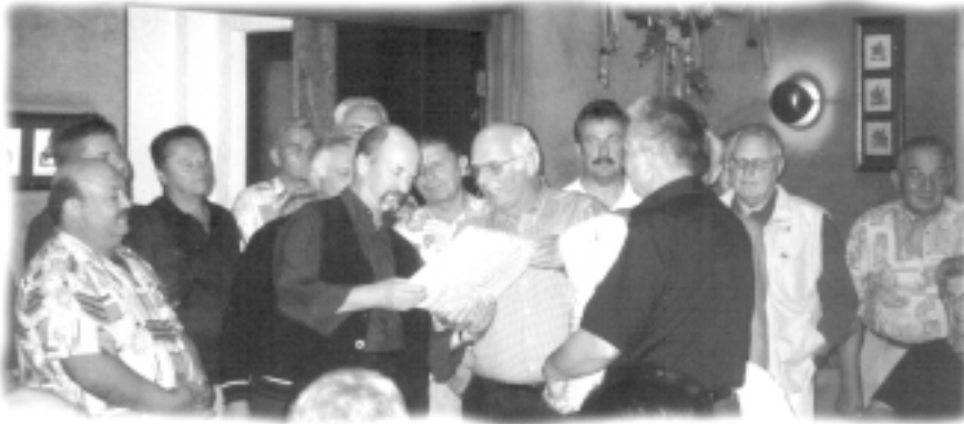
Gemeinsamer Abend der Chöre aus Neuenkirchen und Kleinblittersdorf im Restaurant "Roter Hahn".