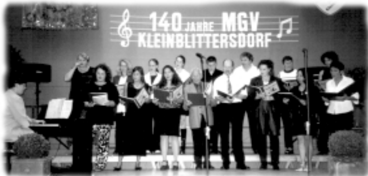
Gospelchor "Humble Voices".