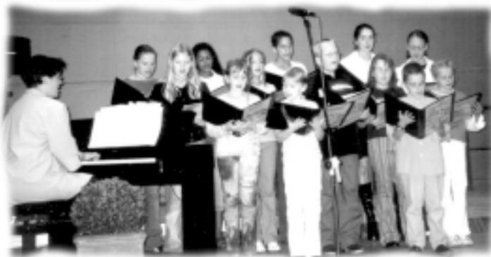
Jugendchor des MGV Kleinblittersdorf

konnt die Gospels und Songs „Signum“, „Let it be“, „It's me, oh Lord“ und „Killing me Softly“ vor.