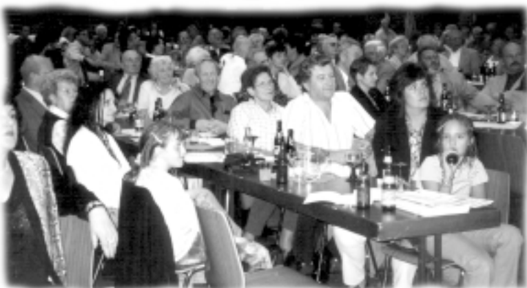
Das Jubiläumskonzert am 14. Sept. war gut besucht.