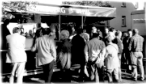
Viel Betrieb am Getränkestand des MGV

Die traditionelle Kirb in Kleinblittersdorf fand wie immer am ersten Wochenende im Oktober statt. Bei schon fast gewohntem, durchwachsendem Wetter führte der Weg vieler Eltern am