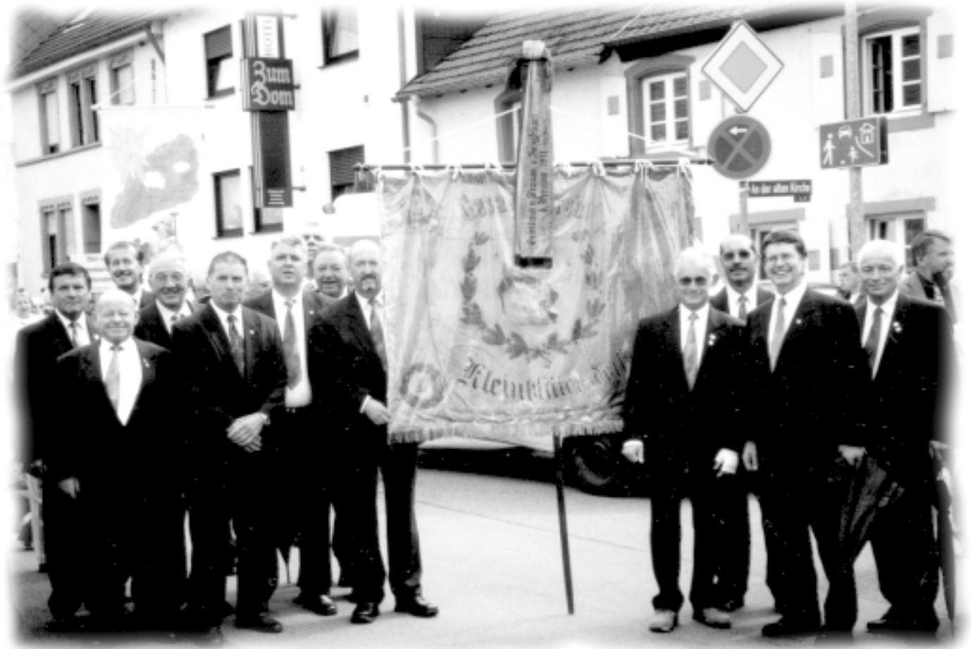
Der Jubiläumschor, MGV 1862 Kleinblittersdorf, nimmt Aufstellung zum Festumzug